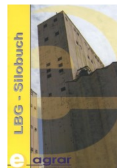
LBG - Silobuch Das spezielle Computerprogramm für das Ein- und Auslagern von Schüttgütern

Damit das möglich ist, muss bei der Einlagerung des Lebensmittels in die Lagerstelle zumindest der Produzent miterfasst und bei eventuellen Umlagerungen mit protokolliert werden. Diese Aufgabe kann nur durch ein spezielles EDV – Programm erfüllt werden.